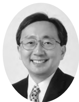
青森県知事 三村 申吾