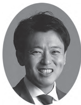
青森県知事 宮下 宗一郎